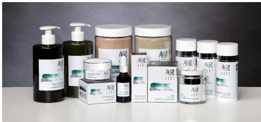
Архангельск. 2020 г

Линия LAMI NARI подходит для любого типа кожи, в том числе и для чувствительной. Специально разработана для зрелой кожи (35+).