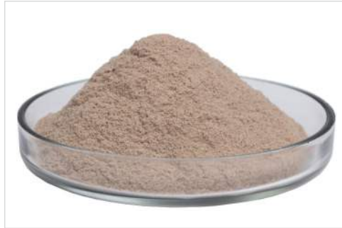
Kosmetisches Produkt Kosmetische Rohstoffe